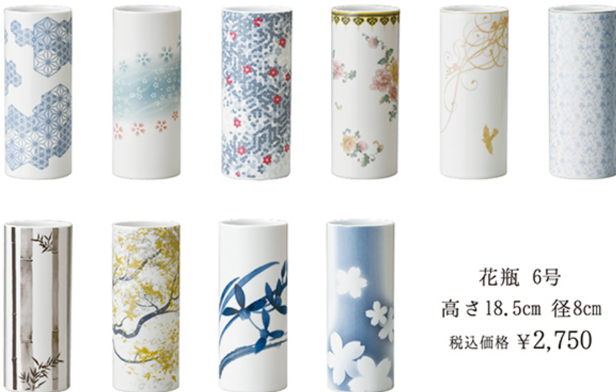
花瓶 6号 高さ18.5cm 径8cm 税込価格 ¥2,750