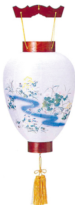
天上けやき 高さ46cm 径30cm 税込価格 ¥8,800