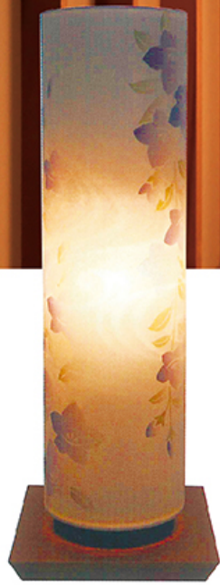
花KAZARI 桔梗 高さ 33.5cm 税込価格 ¥11,000