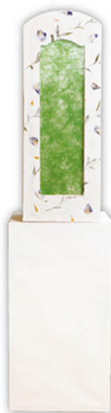
石碑灯籠 押し花 小型タイプ