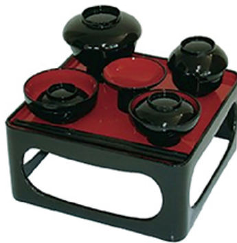
仏器膳(椀・箸付) 5.5号 税込価格 ¥5,300