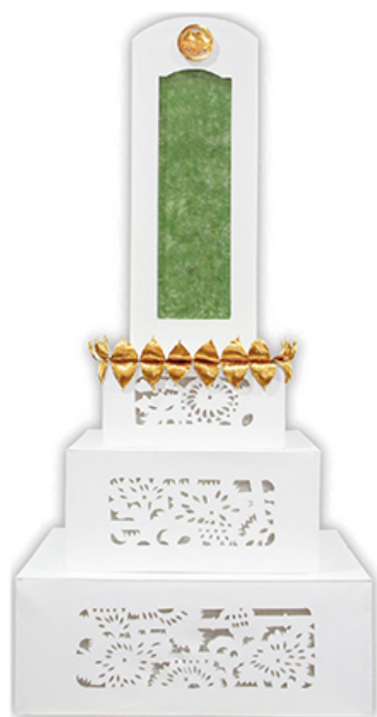
石碑灯籠 伝統的タイプ