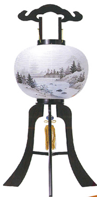
黒檀山水 二重張 10号 高さ83cm 径33cm 税込価格 ¥29,700