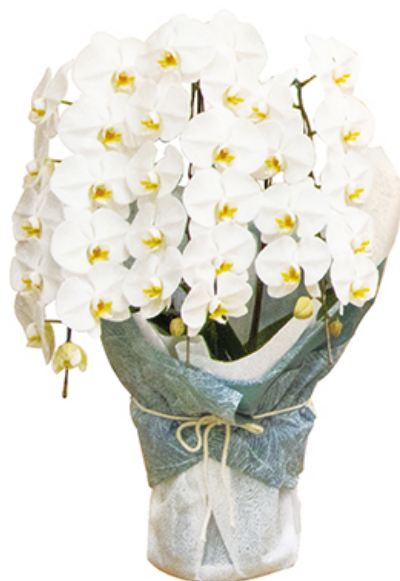
胡蝶蘭 三本立ち 税込価格 1ヶ ¥22,000 税込価格 1対 ¥41,800