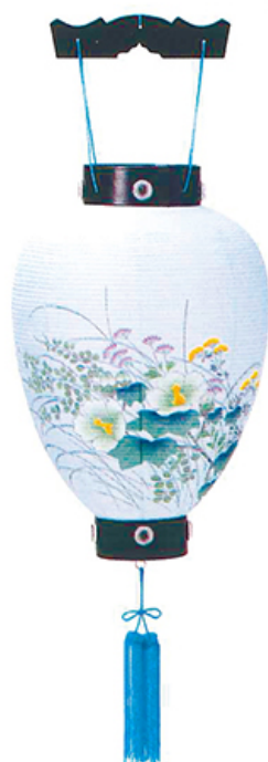
太極黒 高さ46cm 径29cm 税込価格 ¥5,500