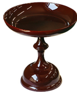
高杯 6号(1対) 税込価格 ¥6,050