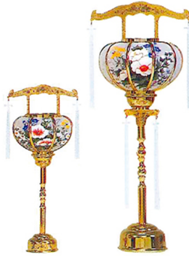
廻転1号 ゴールド 廻転4号 ゴールド

廻転黒 (1対) 1号 39cm ¥6,600 2号 43cm ¥7,700 3号 48cm ¥8,800 4号 58cm ¥11,000 (税込価格)