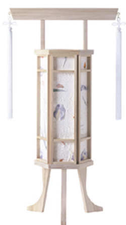
千寿2号 (1対) 高さ 58cm 税込価格 ¥11,000