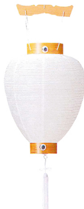
白提灯 相極紋天 高さ43cm 径28cm 税込価格 ¥2,750