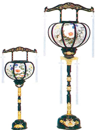
廻転1号 黒 廻転4号 黒