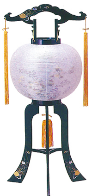
廻転涼仙 二重張 高さ80cm 径33cm 税込価格 ¥11,000