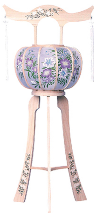
桂1号 (1対) 高さ 85cm 税込価格 ¥19,800