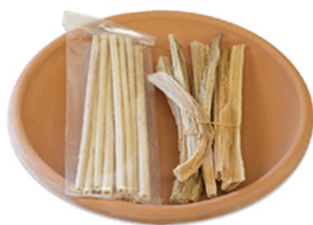
皿 (松明、麻がら付) 直径26.5cm 税込価格 ¥1,650