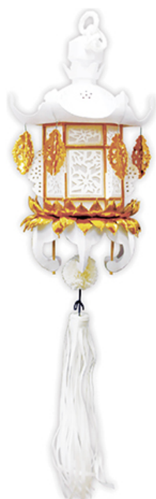
切子灯笼 金柱二重もみじ 税込価格 ¥13,200