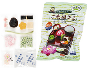
フリーズドライの仏膳用惣菜セット 「ご先祖さま」 税込価格 ¥600