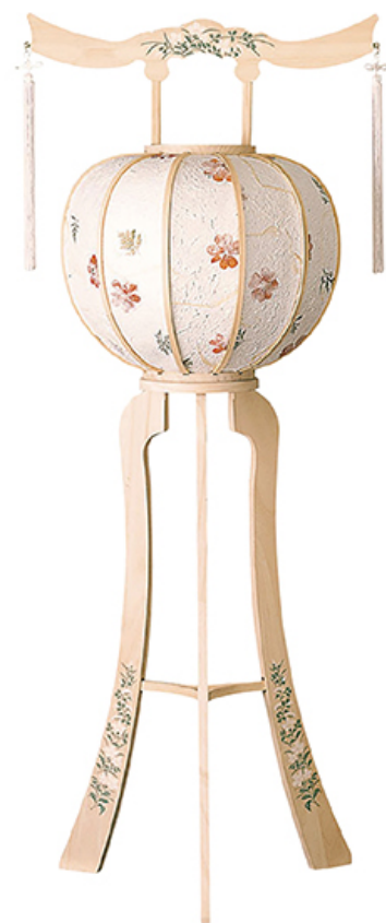
桂3号 花の舞 (1対) 高さ 115cm 税込価格 ¥25,300