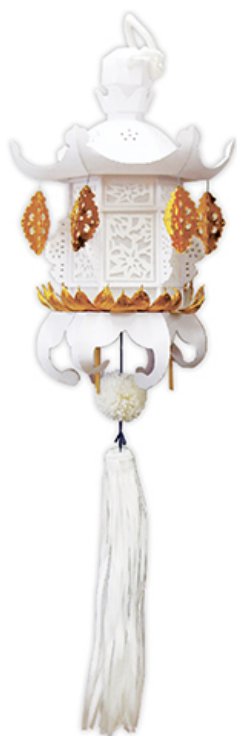
切子灯笼 金一重 白 税込価格 ¥11,000