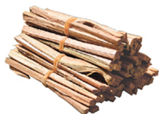
松明 長さ18cm 税込価格 ¥2,750