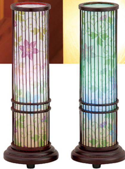
夢灯り (1対) 高さ 28cm 税込価格 ¥27,000