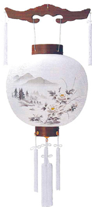
特二丸焼杉 高さ42cm 径36cm 税込価格 ¥8,800