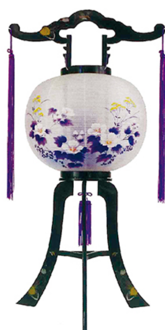
廻転紫光 高さ80cm 径33cm 税込価格 ¥7,700