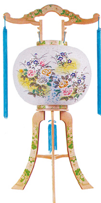
廻転十和田 高さ80cm 径33cm 税込価格 ¥8,800