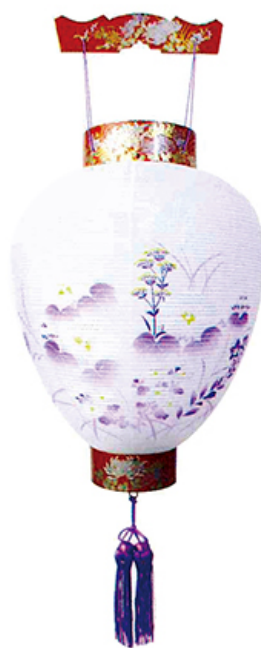
天上チリメン紫絵 高さ46cm 径30cm 税込価格 ¥7,700